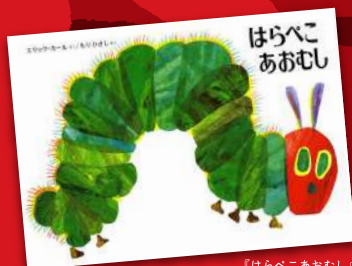
『はらぺこあおむし』 エリック・カール 作 もりひさし 訳 出版: 偕成社