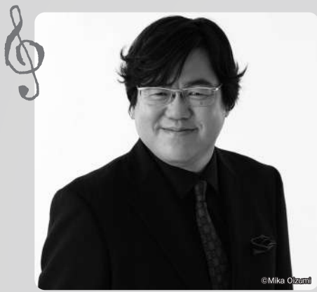
なかがわ けんいち 中川 賢一 〔ピアニスト〕 Ken'ichi Nakagawa, piano

桐朋学園大学音楽学部でピアノと指揮を学び、卒業後、ベルギーのアントワープ音楽院ピアノ科首席修了。1997年オランダのガウデアムス国際現代音楽コンクール第3位。帰国後は、ソロ、室内楽、指揮で活躍する他、国内外の様々な音楽祭に出演。NHK-FMなどに度々出演、新曲初演多数。ダンスや朗読など他分野とのコラボレーションも活発。指揮者として、東京室内歌劇場、東京フィル、広響、仙台フィル他と共演。東京フィル、札幌、水戸室内管等ではピアノ演奏とトークのアナリゼを展開し好評を博す。子供向けのプロジェクトも多く、未就学児参加可能な演奏会のプロデュースも数多く行っている。北九州には2009年よりアウトリーチやコンサートで度々登場。以来、北九州&もつ鍋が大好きとなる。現代音楽アンサンブル「アンサンブル・ノマド」のピアニスト、指揮者。(一財)地域創造公共ホール音楽活性化事業登録アーティスト。お茶の水女子大学、桐朋学園大学非常勤講師。 http://www.nakagawakenichi.jp